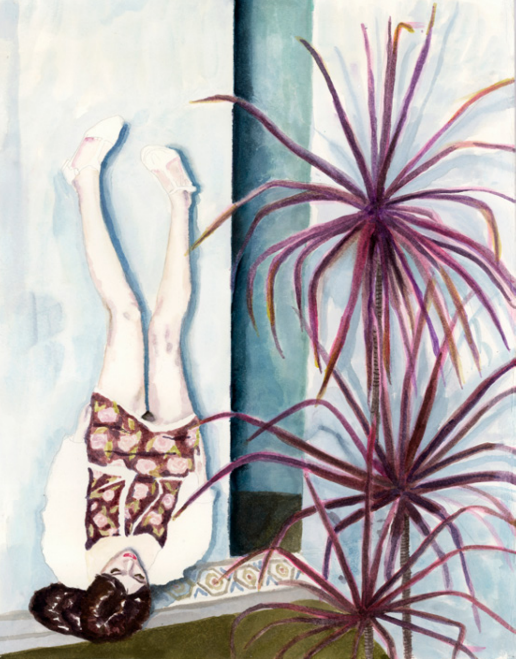
תמר שחר, Jacob's Ladder, טכניקה מעורבת (אקוורל ואקריליק), 36x46 ס"מ