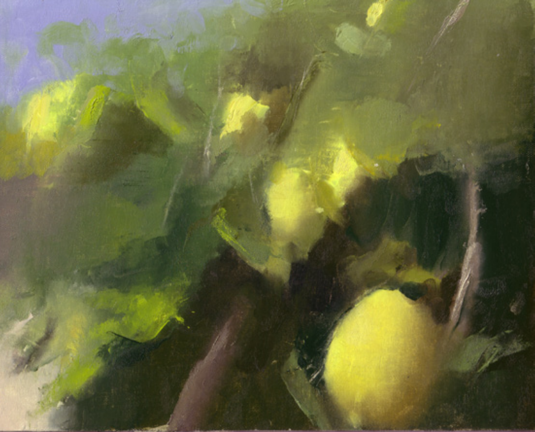
גיל הלר, Lemons, שמן על עץ, 50x40 ס"מ