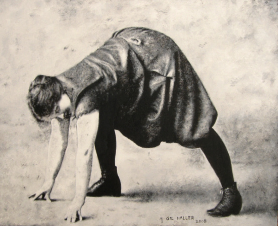
גיל הלה, A severe exercise for strengthening the back, שמן על עץ, 30x25 ס"מ