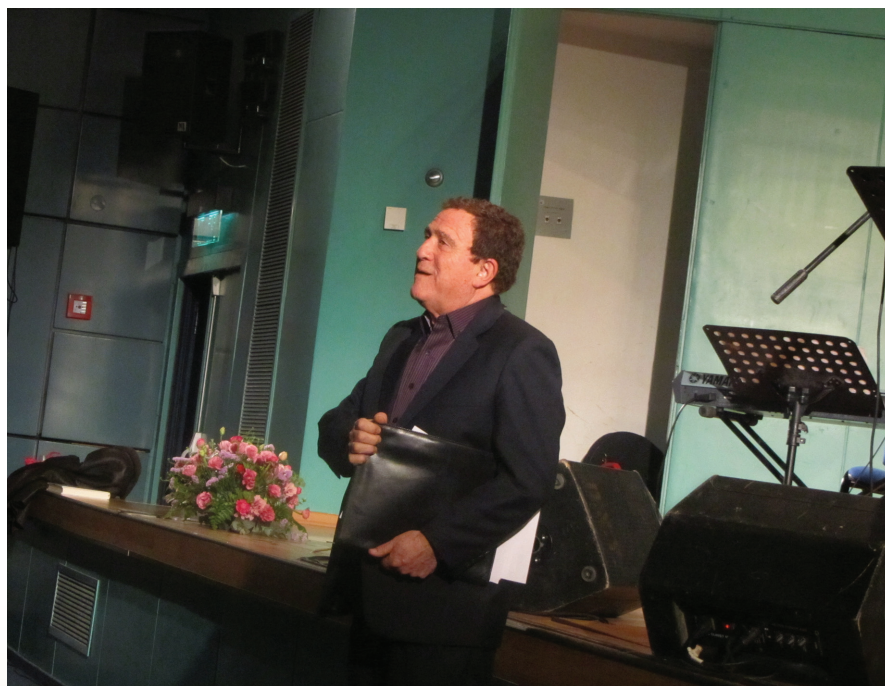
Yehoram Gaon en la reunión de los amateurs del Sentro Gaon

Komo kada anyo organizimos una jornada de estudio en kolaboración kon