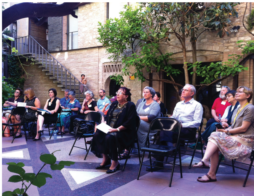
Opening ceremony in Girona conference