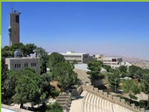
קמפוס הר הצופים