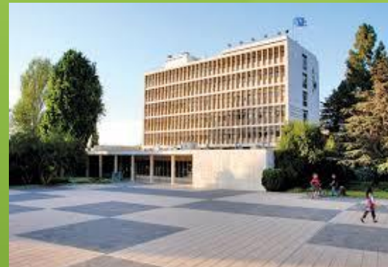
קמפוס אדמונד י' ספרא – גבעת רם