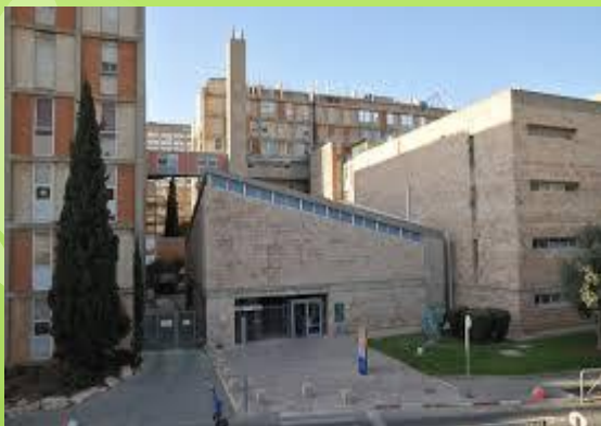
קמפוס עין כרם