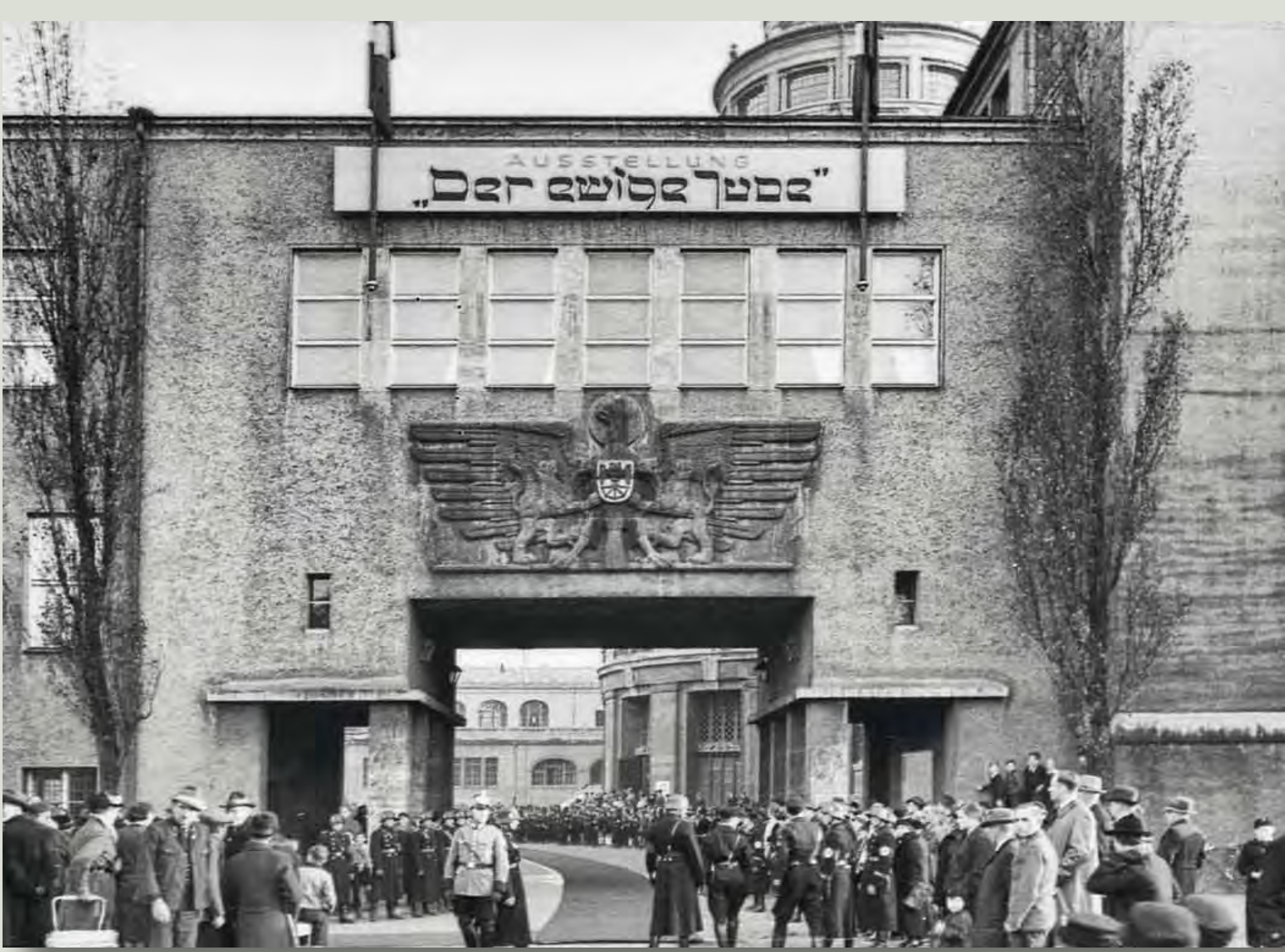
תערוכה, "היהודי הנצחי", מינכן, נובמבר 1937

בתערוכה היה גם חלק בנושא "לופטוואפה" שהעמיד מיצגים כ"חדר אקלים ותת-לחץ גדול עם מכונות גליות ומכשיר נטגן בעל ביצועים חזקים", כמו גם "מודל של צנטריפוגה לניסויי האצה בבני אדם, עם מכשיר נטגן משולב".