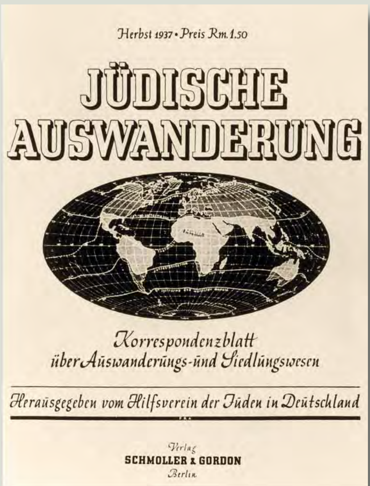
הגירה יהודית / כותרת ספר (1937)

זוגם אינם ממוצא ארי. כל מי שאבותיו אינם אריים, במיוחד אם יש לו הורים או סבים יהודים, ייחשב למי שאינו ארי. די שהורה או סב אחד יהיה ממוצא שאינו ארי. הדבר תקף בייחוד אם הורה אחד או סב אחד נותר דבק ביהדותו. מוצא שמחוץ לנישואין נחשב גם הוא כמוצא אבות", על פי קטע מהפקודה השנייה שבתקנות הקבלה.