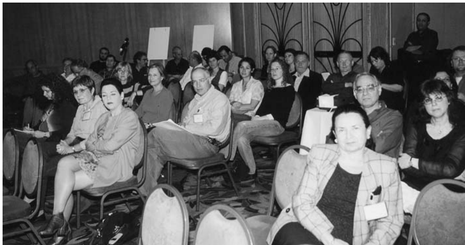
חלק ממשתתפי הכנס