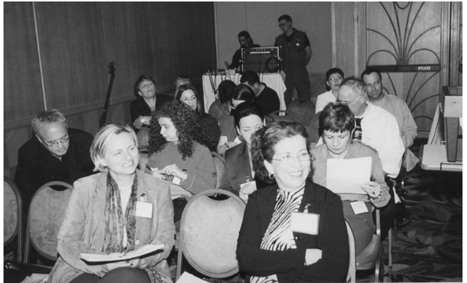
Participants in a session at The 5th Annual Conference