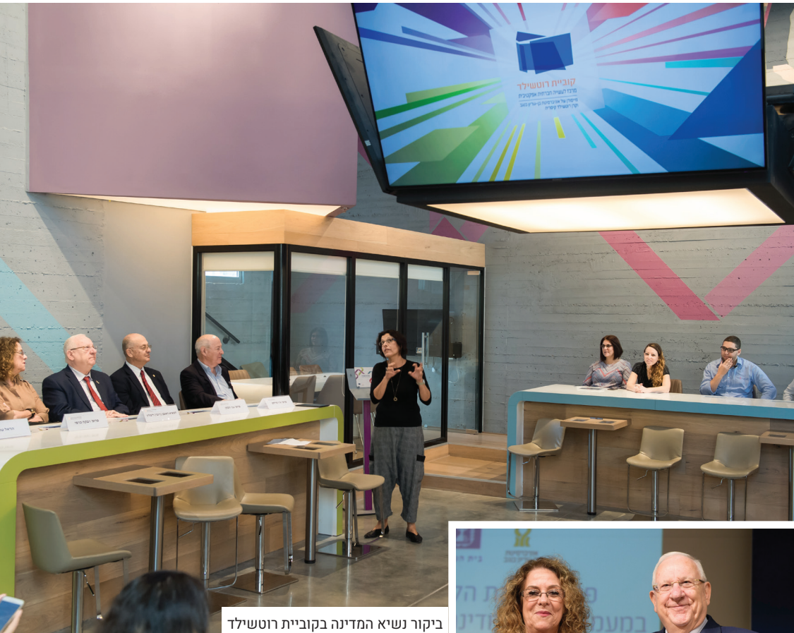
ביקור נשיא המדינה בקוביית רוטשילד

סטודנטים וחברי סגל ערבים יוצרים שיח בערבית בבית