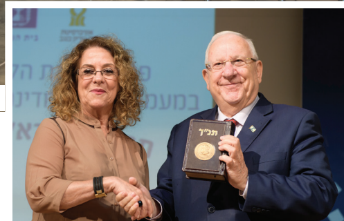
נשיא המדינה ריבלין עם נשיאת האוניברסיטה פרופ' כרמי