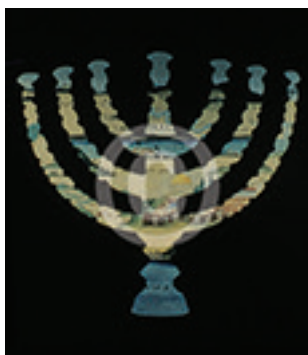
מנורת שבעת הקנים על רקע מפת המקומות הקדושים בארץ ישראל, וירושלים במרכז. בית התפוצות, תצוגת הקבע