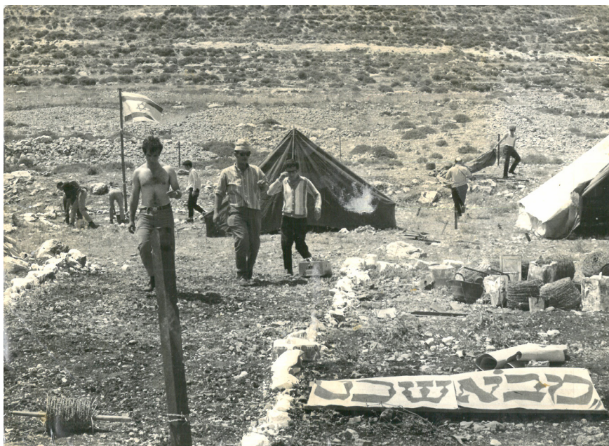
תצלום מהניסיון להקמת מבוא שכם, מאי 1970.

הצעירים הניפו את דגל ישראל והציבו שלט ועליו המילים 'מתנחלי בית"ר'. הם תחמו את המקום בגדר והקימו שני אוהלי מגורים, אוהל למטבח ואוהל לעזרה ראשונה. כשהגיע זאבי למקום הוא הורה להם להתפנות, ומשלא נשמעו לדבריו נצטוו העיתונאים ואנשי הטלוויזיה לעזוב את המקום. עיתונאי מעריב אברהם בנמלך הציג את עצמו כאחד המתנחלים, וכך הצליח לתעד את הנעשה ולשלוח למערכת העיתון כתבה שנפתחה בתיאור הזה: