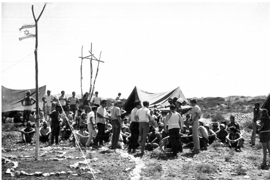
חברי קבוצת שכם במהלך הניסיון החמישי להקים התנחלות, ביתר-ביתר, אוגוסט 1970.

כיתת חיילים שהובאה למקום [...] ניסתה בקתות [הרובים] לדחוף את העומדים. באותה שעה נטל אחד החיילים מיכל דלק והחל לשופכו על אוהל העזרה הראשונה, וכעבור דקה היה האוהל ואשר בו למאכולת אש. מכאן עברו לאוהל השני והפכוהו על פניו, הגיעו לאוהל השלישי והעלוהו באש. [...] כל אותה שעה עמד האלוף על גבי תלולית נישאה מעל המחנה וצפה בנעשה כבהצגה. [...] כל המעשה הוא מקלי ראשון וממראה עיניים. משה חנוכה. 47