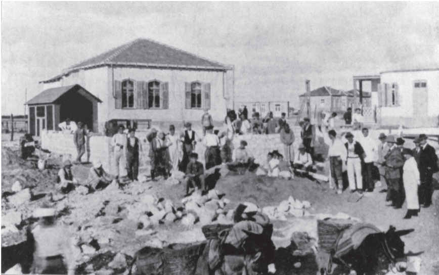
הבית הראשון שבנתה חברת קדם בתל אביב (אוסף משפחת מזורסקי, נהריה)

מלווה בתמונות של פנים בניין בלה ויסטה, ובו שולחנות העבודה של האדריכלים, המעבדה לניסוי בחומרי בנייה ונגריית הרהיטים. 14 לרוע המזל, ב־1 במאי 1921 פרצו אירועי הדמים ביפו, וגם מתחם בלה ויסטה הותקף. החברה העתיקה את משכנה מיפו לתל אביב, לבית טרכטנגוט שברחוב ליליינבלום 1/3, מול ראינוע עדן. משם ניסתה לאשש את פעילותה, ואולי אף לנצל את הנהירה מיפו לתל אביב, שהחלה בעקבות המאורעות. העבודות העיקריות שבהן החלה קדם בשלב זה היו סלילת רחוב על פי הזמנת ועד תל אביב, בניית מבנה מגורים במחיר נמוך יחסית של 700 לירות מצריות, שהניבה הזמנות בערך של 10,000 לירות מצריות, תכנית להקמת בית משרדים לקק"ל בירושלים, ועוד. הפרויקט הגדול שייעד לוי לחברה היה הקמת רובע מגורים בסגנון עיר גנים לידי יפו, עבור 150 משפחות שביקשו להשקיע ברובע החדש ולהשתכן בו, ועבור בעלי מלאכה שחשבו להקים בו את מפעלי הייצור שלהם. בסופו של דבר לא הגיע הפרויקט לכלל ביצוע ונותר על שולחנות העבודה של קדם. בראשית פעולתה, באביב 1921, יצאה חברת קדם ביוזמה מעניינת: היא הציעה לשלטונות המנדט להקים נמל יבשתי פנימי ליפו, שבנייתו תהיה זולה בהרבה מהעבודות הכרוכות בנמל ימי. בתכנון היה מעורב גם האדריכל הנוודע ריכרד קאופמן, ולוי ניסה לעניין את הברון רוטשילד בשותפות בהשקעה בבניית הנמל. 15 גם רעיון זה לא זכה למימוש.