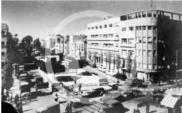
תמונה 1. בית בֶּנִין, שנות החמישים המוקדמות, לאחר הוספת הקומות הרביעית והחמישית ובניית פרגולה על גג הבניין, שינויים שהושלמו בשנת 1952 27

שעליה נבנה הבניין בראשית שנות העשרים, בניגוד לחוק והודות לאישור חריג מן הנציב העליון דאז הרברט סמואל, שניתן הודות לתרומתה של משפחת בֶּנִין לקידום האינטרסים של האימפריה הבריטית באזור. 28 ייתכן כי הפקעת האגף המזרחי של הבניין, זה הפונה לרחוב נחלת בנימין, בשנת 1942 בשם המאמץ המלחמתי, 29 היתה דרכה של ממשלת פלשתינה-א"י לתבוע גמול בדיעבד על הקלה זו.