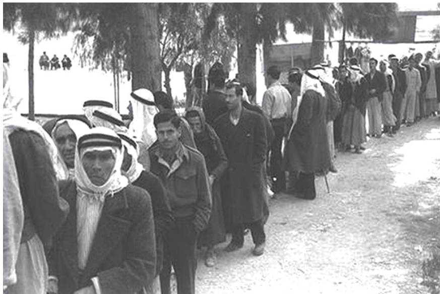
בתור לרישום ולקבלת תעודות זהות ישראליות

המנהיגות במרד של 1936-1939, גילה יוזמה ואחריות, שמעטים מראשי הערים הערביות הפלסטיניות גילו במהלך המלחמה. הוא לא סמך על ההנהגה הארצית של הוועד הערבי העליון, ולא בטח במי שעמד בראשו, חאג' אמין אל-חוסניני. הוא הצליח לתמרן בין כל הגורמים בהובילו את עירו לחוף מבטחים.