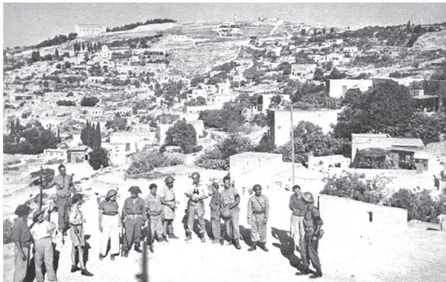
מפקדי מבצע דקל בצילום מזכרת – ברקע העיר נצרת כפי שנראתה בעת הכיבוש ב-1948