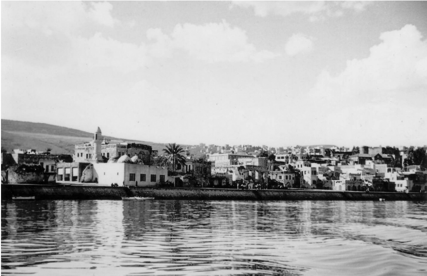
מראה העיר טבריה מכיוון מזרח, לפני ההרס