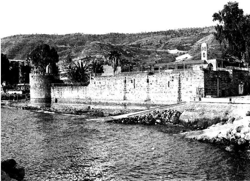
מראה העיר טבריה, הכנסייה והמנזר