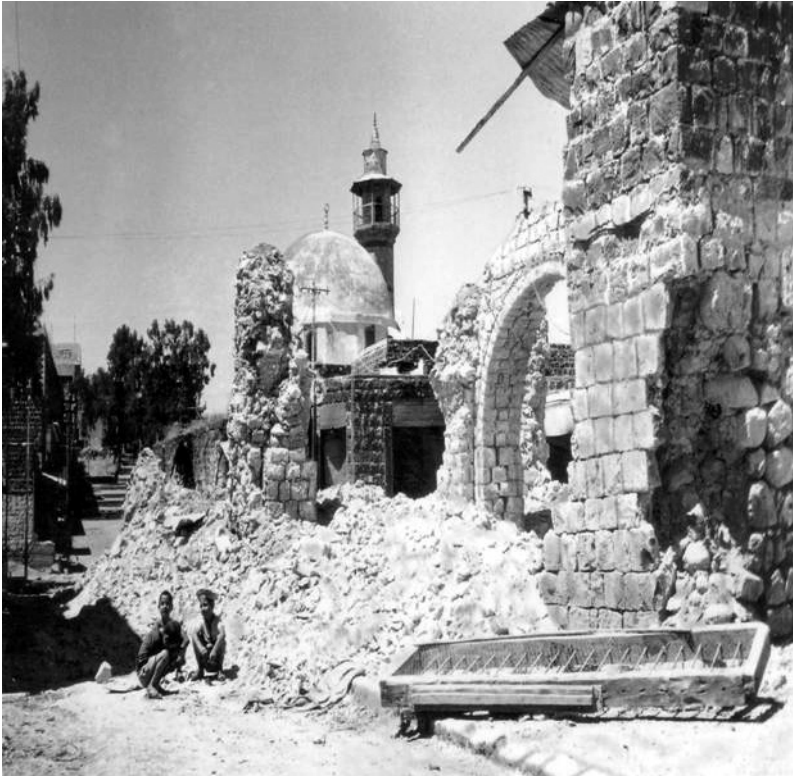
ההריסות, חלק מרחוב הגליל