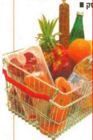
ליקוח, דרכי פרסום, מכירות מיוחדות במקרה של פגיעה בצרכנים יתעד

בכד המספרות ממונים כ־300 נקודות מכירה תפעיל המועצה