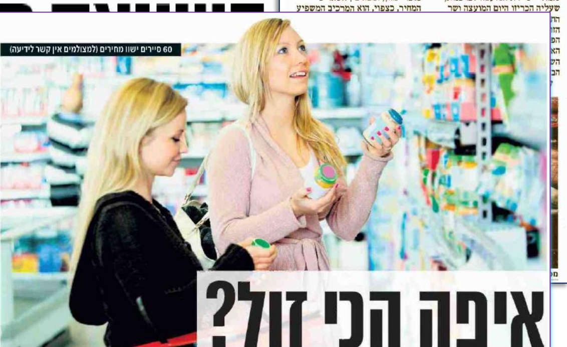
60 סוירים ישו מחירים (למצולמים אין קשר לידיעה)

החנויות בת"א. מנה נוכח בת"א ב"ד נקודות, חמישית מסניפיה בעיה אין ייצוג בסקר ל־AM:PM המפעילה כ־40 סניפים בעיה. בחי סבא ולא 365