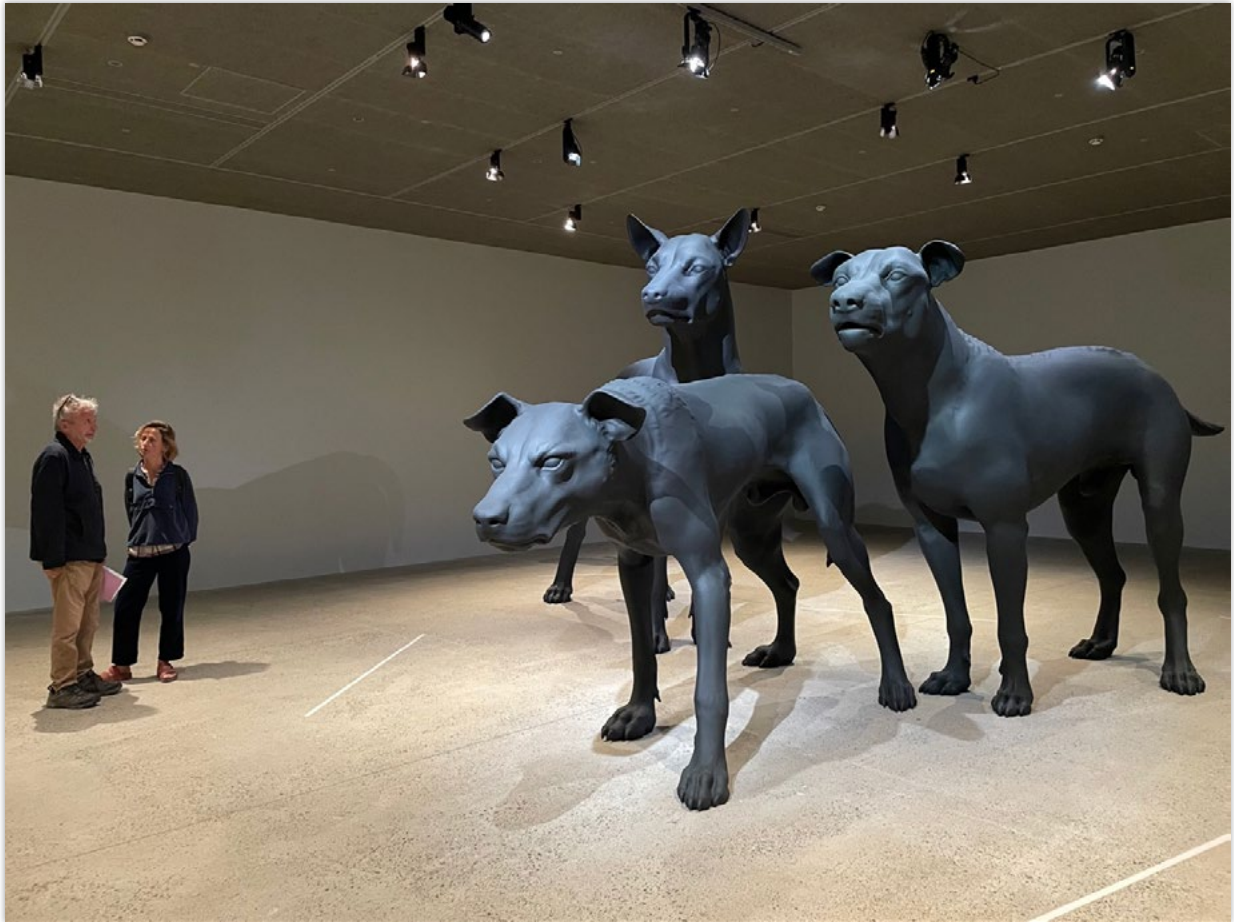
תמונה 4. Ron Mueck, Untitled (Three Dogs) , 2023, mixed media, variable dimensions, Courtesy Thaddaeus Ropca. Photograph by Shira Gottlieb

הצופה. זו עבודה מרתקת, וקשה להישאר אדישים מולה. קרבתם של הכלבים לקיר כאילו נדחקו לשם, עמידתם בעמדת תקיפה, אוזניהם הזקופות וההבעה שעל פניהם, מצביעים כולם על סכנה שעומדת להתרחש, ויחד עם גודלם זהו מראה מעורר-אימה.