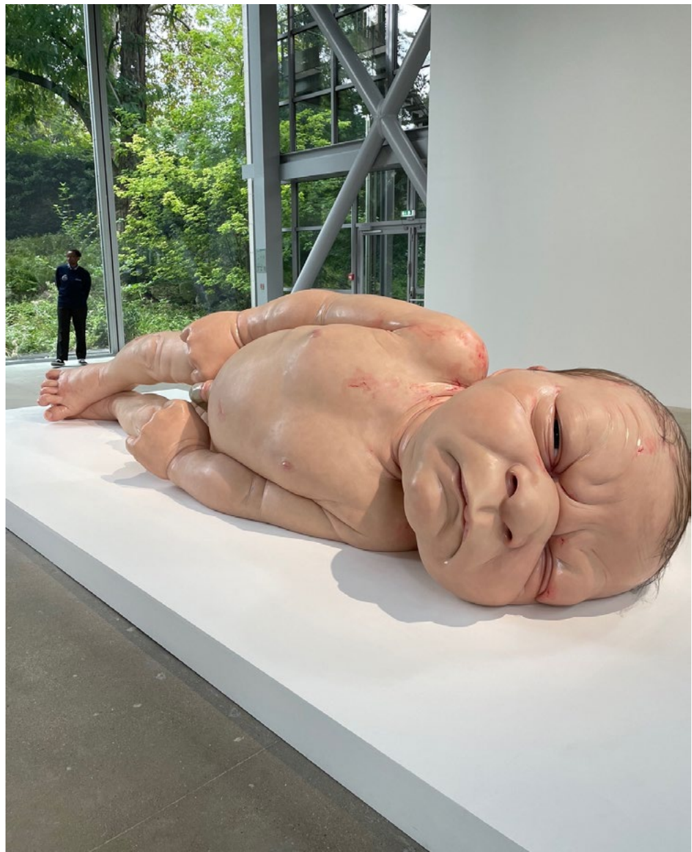
תמונה 2. Ron Mueck, A Girl , 2006, mixed media, 110.5x501x134.5 cm, Scottish National Gallery of Modern Art, Edinburgh.

בגלריה השנייה בקומה זו נמצאת העבודה A Girl (2006, תמונה 2), שמציגה בממדי ענק תינוקת שזה עתה נולדה, נושא שחוזר על עצמו בעבודותיו של מיואק. גופה של התינוקת עדיין מקומט ומעוות, ועורה מכוסה בשאריות דם ונוזלים מהלידה. העבודה מרתקת בפני עצמה בזכות הנוכחות והגודל של הפרטים הוויזואליים ה"דוחים" וה"מלוכלכים", שבדרך כלל מועלמים מגופם של תינוקות מייד לאחר לידתם, ואשר משדרים סוג של בזות – כפי שכינתה זאת ג'וליה קריסטבה – בין אם של התינוקת עצמה או של אמה, שאינה נוכחת בעבודה. 1 יחד עם זאת, מעגל החיים, או הממנטו מורי האוצרותי, שמתהווה מתוך הצבת הגולגולות מצד אחד והתינוקות שרק נולדה מצד שני, על רקע הגן הטבעי הנשקף מבעד לקירות הזכוכית הגדולים – מעניקים רבדים נוספים גם לכל עבודה בנפרד. אבל כאן לצערי הסתיים החלק המעניין של התערוכה, לפחות מבחינת האוצרות.