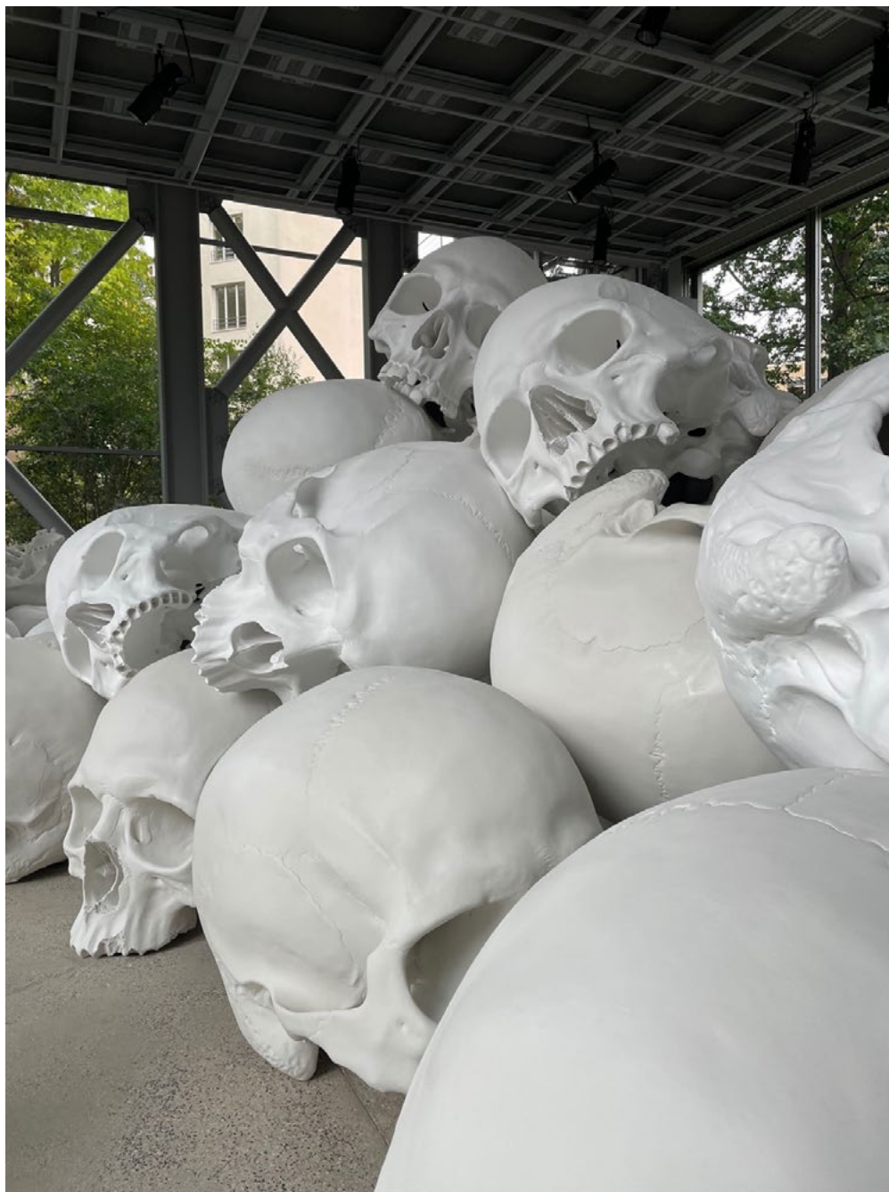
תמונה 1. Ron Mueck, Mass , 2017, mixed media, variable dimensions. National Gallery of Victoria, Melbourne, Felton Bequest, 2018.

וחצי העשויות פייברגלאס צבוע בצבע פולימרי סינתטי, ערומות זו על זו בחוסר סדר ברחבי החלל. בניגוד לעבודותיו האחרות, שעוסקות באינדיווידואליות של הדמויות המוצגות מבחינת תווי פניהן, שיערן, מבנה גופן וכדומה – הגולגולות כמעט זהות, למעט השיניים שכמו נותרו על כנו, והצבתן בערמות מבטלת כל ייחודיות ומדגישה את הבנאליות שבמוות. גולגולת נוספת ( Dead Weight , 2021), יחידה, העשויה ברזל יצוק, ממוקמת בחצר המוזאון ומתכתבת עם אלה הלבנות. בין אם במתכוון או שלא, ערמת הגולגולות מזכירה מאוד את הקטקומבות של פריז, אתר קבורה תת־קרקעי המכיל יותר משישה מיליון שלדים אשר פרושים זה על גבי זה. הקרבה בין הקטקומבות לשתי העבודות של מיואק אינה אסוציאטיבית בלבד אלא גם פיזית, שכן הכניסה לקטקומבות נמצאת כ־400 מטרים מהמוזאון.