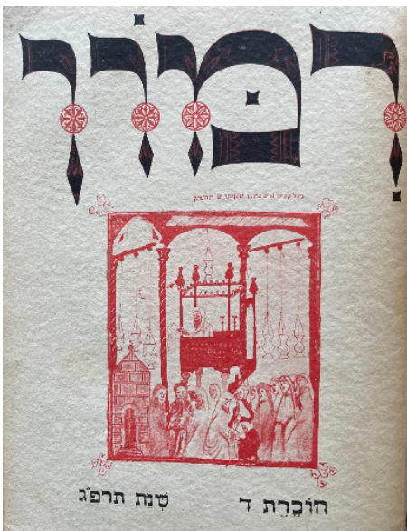
איור 1. שמואל יוסף עגנון, "מעשה עזריאל משה שומר הספרים", רמון: מאסף עתי לאמנות ולספרות ד, ברלין (תרפ"ג), עמ' לה.

משום אותה יראה שהפגין כלפי ייצוגי הקדושה האיקוניים, שלא הבין, היה משנן על פה גם את שמות הספרים הטבועים על גבי הכריכות, כאותם משנני סוטרות בדתות המזרח הרחוק – כלומר כפרפורמטיביות ווקאלית וריטואלית, שמבצעה מייחסים לה מובן של קדושה טקסית, נטולת הבנה בסמנטיקה של סימניה הספציפיים. 10 איבורו הזה של עגנון המיר אפוא את המסומן של הטקסטים בשינון סימניו החומריים (הכריכות והכיתובים שעליהן), ואתם חקק כאפיטפים על גבי קורות ביתו. כך מתאר עגנון את הריטואל של רישום הספרים: