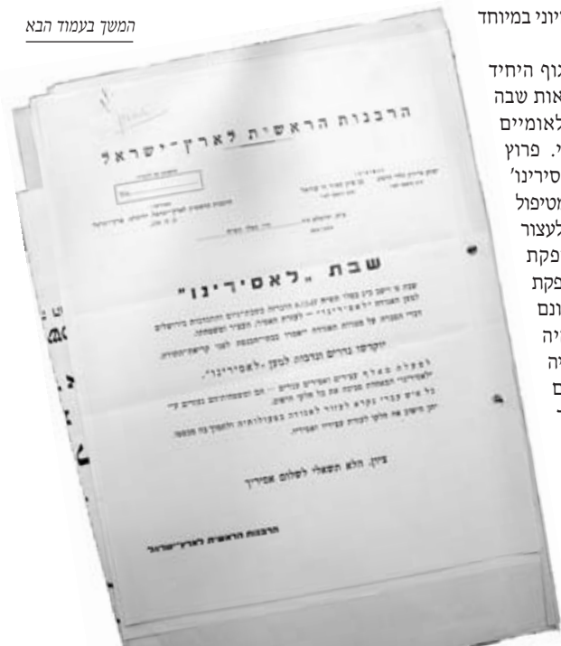
המשך בעמוד הבא

אך גם במקרה זה כמו במקרים רבים אחרים, המשימה לא היתה כל כך פשוטה. מאחר והמקומים היו אנשי מפא"י והסתדרות העובדים הכללית, הם עוררו כמובן את חשדה של התארגנות אחרת, שהייתה מזוהה עם ברית הצה"ר (הסתדרות הציונים הרביזיוניסטים) שהייתה הגוף הפוליטי האופוזיציוני למפא"י ולקואליציה שיצרה במוסדות הלאומיים. הגוף ה'מתחרה', כינה את עצמו "הוועדה לעזרת משפחות העצורים" וטען בתוקף שהחזות ה'כלל ישובית' של 'לאסירינו' היא תרמית. הם טענו שהאגודה לא כוללת נציגים מכל גווי הקשת