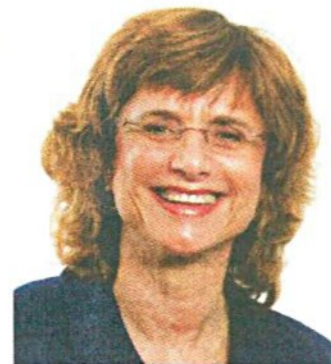
פרופ' דפנה שורץ

באזור ובמדינה. כלומר, אותם גופים חייבים לראות את מכלול הגורמים המשפיעים על הפיתוח של הסקטור ולקחת חלק אקטיבי בקידום. אחרת - הסקטור לא מתפתח, והם, כארגון מקצועי, הופכים להיות לא רלוונטיים.