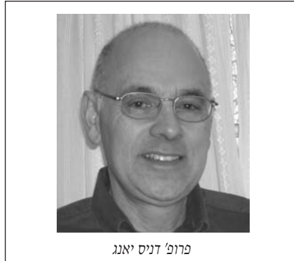
פרופ' דניס יאנג

בו בזמן ארגונים ללא כוונת רווח צריכים לחנך את הציבור אודות צרכים חשובים נוספים שמקבלים פחות תשומת לב, לדוגמא, הסכנה ממלריה ואיידס בחלקים מהעולם, גדולים יותר מהפגיעה של הצונאמי, אולם הם ידועים פחות.