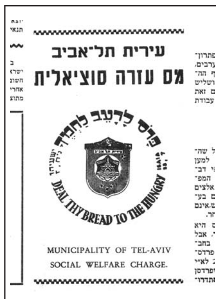
מתוך 'מסחר וכלכלה', בטאון המעמד הבינוני בארץ ישראל, ינואר 1947.

מטבחי הפועלים, שפעלו במושבות היהודיות ובערים היהודיות בארץ ישראל מאמצע העשור השני של המאה העשרים, ענו על הגדרה זו כאשר סיפקו צורך חיוני שהטיפול בו נפל בין הכסאות – הצורך בהזנה.