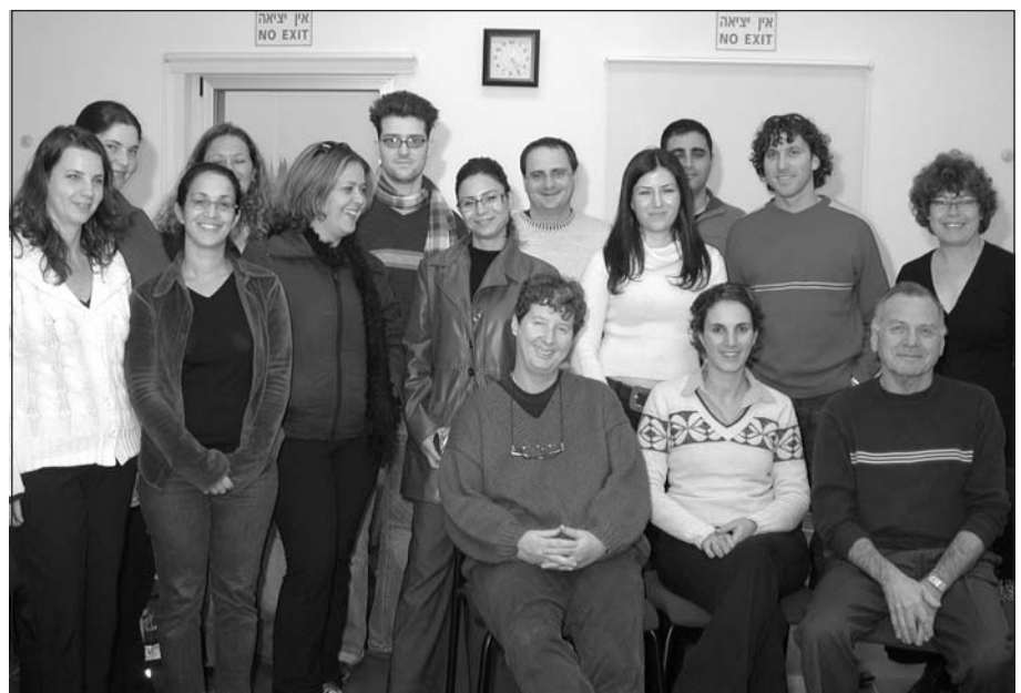
תלמידים וסגל המגמה לניהול מלכ"רים

ההתפתחויות הכלכליות, החברתיות והפוליטיות בעשור האחרון הביאו להרחבת