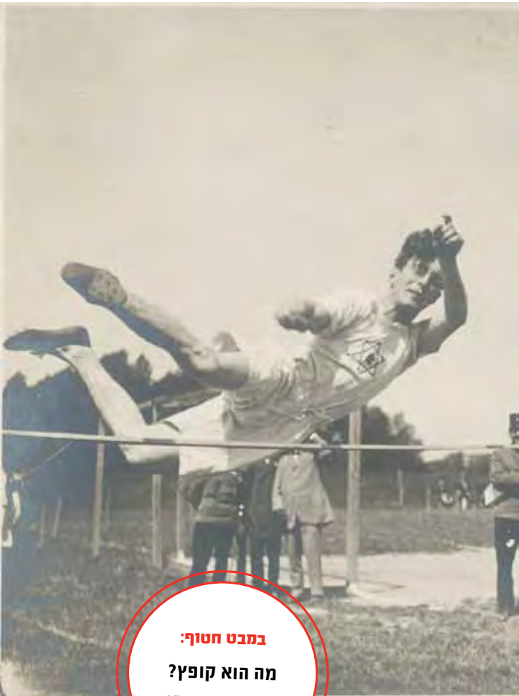
במבט חטוף: מה הוא קופץ? תשובה בעמוד 65