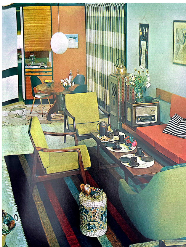
חדר מגורים, מתוך: ארנה מאיר ואליעזר מרקין (עורכים), אנציקלופדיה לבית: ביתנו מאז עד ת, מסדה, רמת גן [1968]

האמריקנית הייתה להמליץ על עיצוב ועל רהיטים סקנדינביים, בעיקר שוודים ודניים, כשיא הקדמה, ההיגיינה והאסתטיקה בריהוט הבית. בישראל אף החלו בשנות השישים להדריך זוגות צעירים (בעיקר את בת הזוג) לרכוש רהיטים סקנדינביים, מסיבות של עיצוב וגם מרצון להציג בפניהם דרך חדשה לריהוט הבית. היו שראו בסגנון השוודי, הפשוט והבהיר, ובכלל בבחירת רהיטים סגפניים, אמצעי לחינוך הילדים להתנהגות נאותה ולשמירה על היגיינה. אחרים ראו בו תשובה לרהיטים הסובייטיים המגושמים, האפורים והגסים. 84 המטבח הבורגני