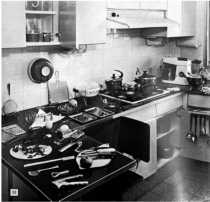
מטבח, מתוך: ארנה מאיר ואליעזר מרקין (עורכים), אנציקלופדיה לבית: ביתנו מאז עד ת, מסדה, רמת גן [1968]