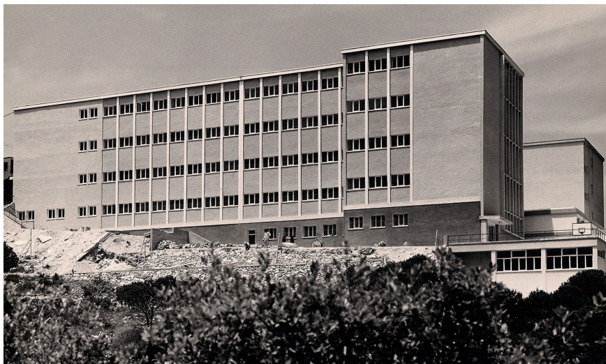
בית הספר עירוני ה', רחוב ביכורים, חיפה, 1964. במבנה זה התקיימו הלימודים במכון האוניברסיטאי של חיפה בשנים 1965-1967.