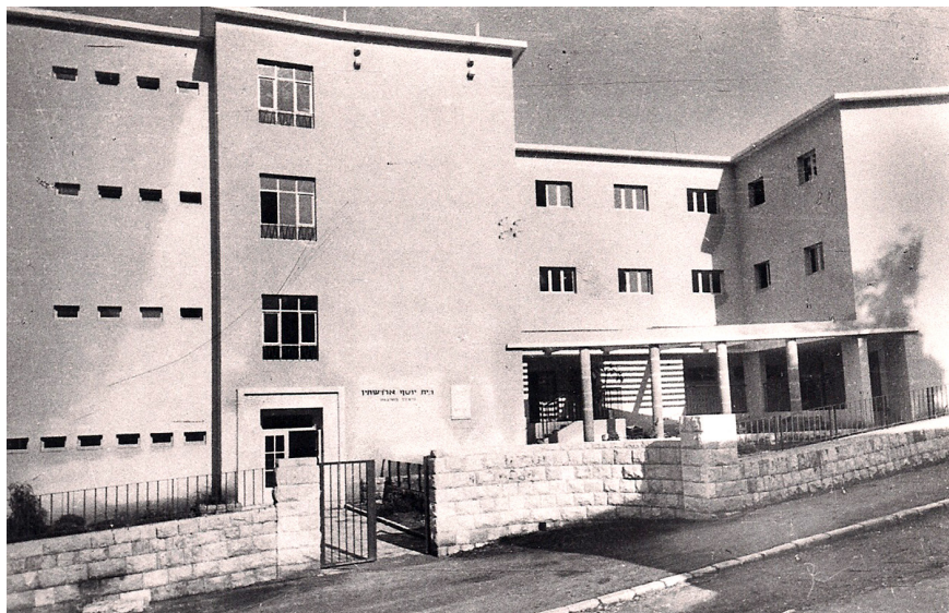
בית ארדשטיין, רחוב י. ל. פרץ 20, חיפה, 1963. במבנה זה התקיימו הלימודים עם הקמת המכון האוניברסיטאי של חיפה.

כי בינתיים חוק המועצה להשכלה גבוהה עבר, ומעתה הייתה דרושה הכרה של המועצה להשכלה גבוהה במוסד המכשיר. 17 בקיץ 1962 הסתמן שינוי בעמדת משרד החינוך שלפיו הומלץ לפנות למועצה להשכלה גבוהה ולקבל הכרה אקדמית רשמית, בין היתר בשל הצורך הדחוף להכשיר מורים באזור הצפון. 18 בפועל איש לא פנה למועצה להשכלה גבוהה, אולי בגלל אופייה של המועצה והרכבה.