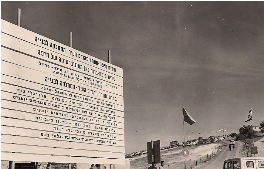
שלט שהוצב בכניסה לטקס הנחת אבן הפינה לקריית האוניברסיטה של חיפה ובו מפורטים שמות קבלני הפרויקט, 21.10.1965.