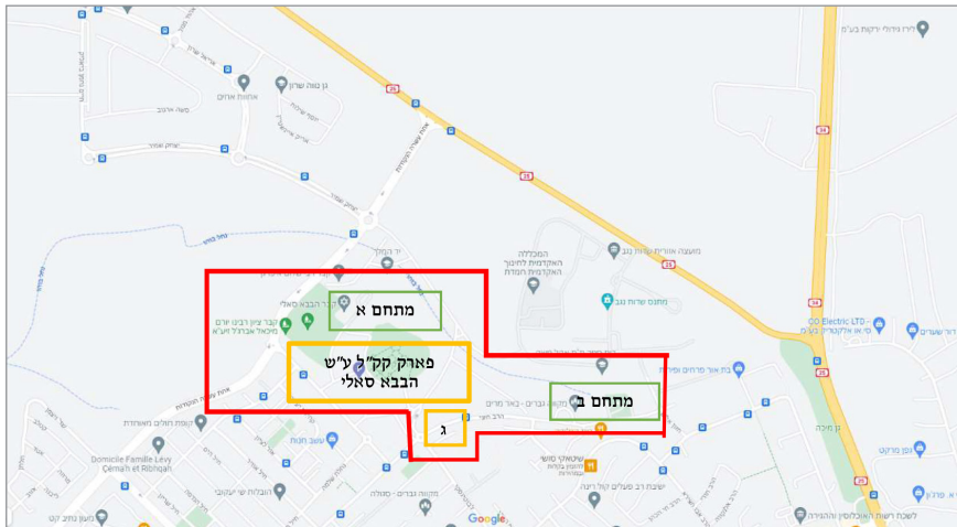
קריית הבבא סאלי על רקע צפון העיר נתיבות, 2022 4

אירוה בעלות כוללת של כ־60 מיליון שקלים. 5 בשולי החניון מקובעים שולחנות יצוקי בטון שמיועדים למבקרים, אשר במסגרת העלייה לקבר נוהגים להשתתף בסעודת מצווה. בשנת 1998 נחנך בסמוך למתחם הקבר פארק קק"ל ע"ש הבבא סאלי בהשקעה כוללת של 14 מיליון שקלים. 6 בפארק ניטעו עשרות עצי דקל 7 ונבנה חניון אוטובוסים לטובת באי ההילולה. מתחם הקבר והחניון הסמוך נעשים פעילים במיוחד, לעתים כדי עומס קיצוני, ביום ההילולה (ד' בשבט): ההערכה היא שביום הזה פוקדים את המתחם כ־80,000 מאמינים, 8 ובמשך השנה כולה כחצי מיליון.