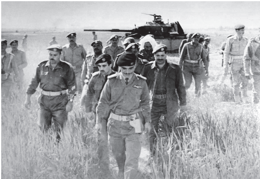
המלך חוסיין וקציני צבאו סוקרים את תוצאות קרב כראמה, 21 במארס 1968 הפופולריות של הפדאיון הרקיעה שחקים בעקבות 'עמידת הגבורה' למול צה"ל.

בישראל עקבו בדאגה אחר המתרחש. החשש היה שהארגונים הפלסטיניים – בסיוע הסורים והעיראקים – יעוררו תסיסה מכוונת בירדן, השושלת ההאשמית תיפול, ובגדה המזרחית תוקם מדינת טרור בחסות בעת'יסטית-סובייטית. 33 לכן ניסו בירושלים לחזק את המלך חוסיין. במחצית הראשונה של 1968, לאחר שארצות הברית הקפידה את הסיוע הכלכלי שניתן לירדן, היה חשש שחוסיין יפנה לגוש המזרחי. לפיכך, ובניגוד גמור לעמדתה המסורתית, משכה ישראל את התנגדותה למכירת נשק אמריקני לירדן – בכלל זה טנקים – וייתכן שאף עודדה זאת בסתר. 34