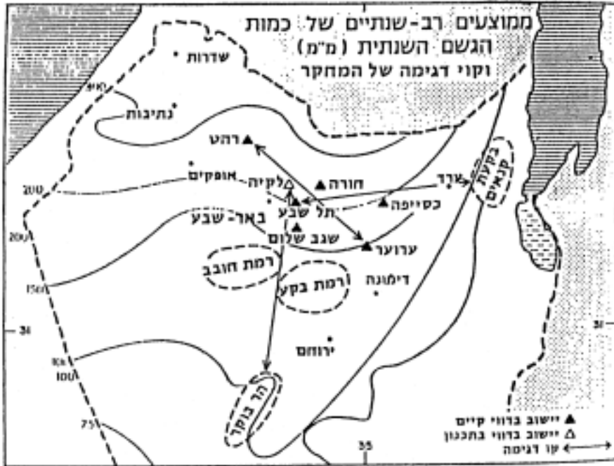
מפה מספר 4: ממוצעים רב-שנתיים של כמות הגשם השנתית בנגב מקור: 'י' בן-דוד, החקלאות הבדווית בנגב: הצעות לגיבוש מדיניות, ירושלים, 1988, עמ' 23.

ואלה השיטות החקלאיות שהציעו מחברי המסמך כדי להשיג את מטרת המדינה: