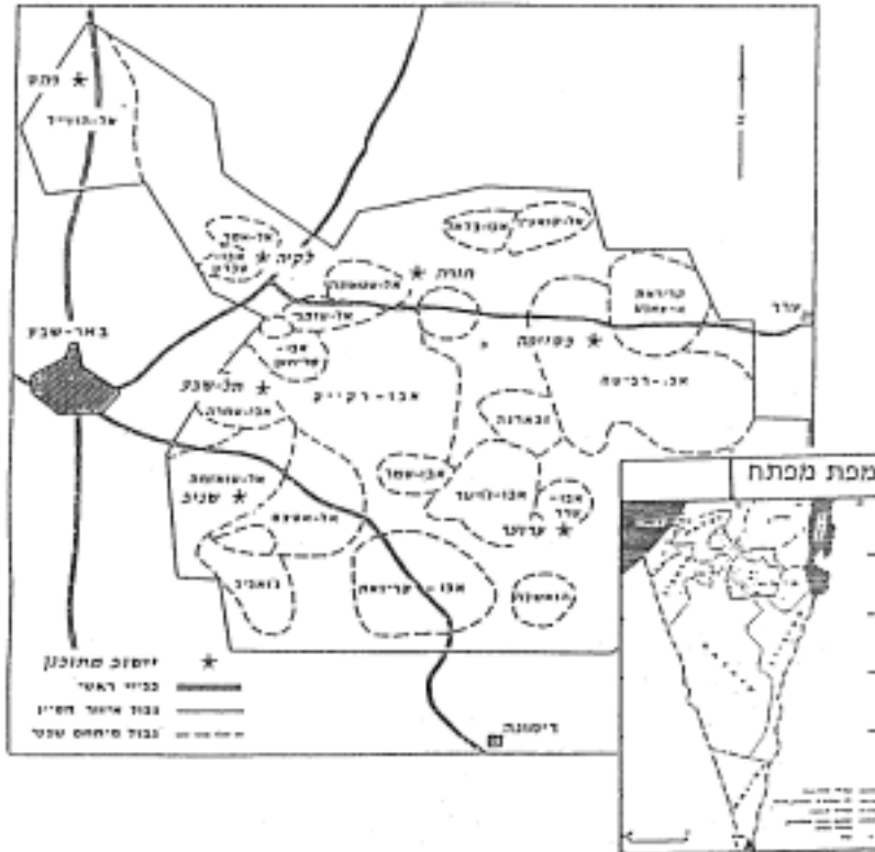
מפה מספר 3: תפרושת שבטי הבדווים באזור הסייג בשנת 1976

השיח' ואנשיו וכי צעד זה הוא נקמה על תמיכתם הפוליטית בשמאל. שר הביטחון דחה מכול וכול את התלונה והוכיח שהשיח' מקבל כל הזמן רשיונות תנועה לו ולאנשיו, ואף יש בידו רשיון תנועה קבוע באזור באר־שבע. כמו כן השיב השר שלא ידוע לו על מקרה שהשלטונות סירבו לספק רשיון תנועה שביקש השיח'. 74