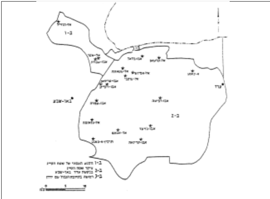
מפה מספר 1: אזור הסייג

אלא שכבר במחצית העשור התברר שאין כוונת המדינה לנהוג על-פי כלל זה ולהשלים את תהליך יישובם של הבדווים ביישובי קבע. יתר-על-כן, עיצוב הישראליים את יחסי הממשל-בדווים שבסייג היה החלטי, בוטה ולחלוטין לא נתן את הדעת על טענות השבטים. הממשל הצבאי יצר תלות כמעט מוחלטת של הבדווים, החיים באזור הסייג, ברצונו הטוב. הקרקעות שהתפנו בנגב הצפוני והמערבי נמסרו ברובן (על-פי חוק רכישת מקרקעין - 1953 שאִפשר לרשות הפיתוח הממשלתית להפקיע קרקע) לעיבוד חקלאי ולבינוי מושבים, קיבוצים ועיירות פיתוח. 2