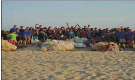
בתמונה שבע צופי ים חיפה מנקות את החוף יום חובה

מעבר להזממות השבט ברוי והים והימאות, דגלו חינוך לקיימות ולאהבת השביבה ראש אנשי עדי טרנצ'י