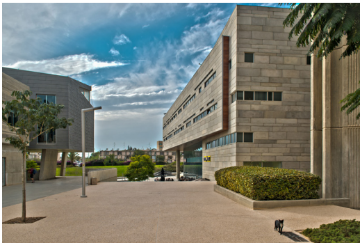
בניין 74 (דילר)

ספורט שרבים מתושבי השכונה חברים בו. בבאר שבע זה יותר מועדון סגור. גם אם יש סרטים בתוך האוניברסיטה, אתה לא תמצא בהם תושבים של העיר. בבית הקפה של האוניברסיטה לא תמצא תושבים של העיר, על אף שבכל השכונות האלה אין כמעט בתי קפה. חנות הספרים משרתת רק אנשים שמגיעים אל האוניברסיטה. יש כאן הפרדה מובהקת. בין שכונה ד' לאוניברסיטה נבנתה לאחרונה כיכר גדולה עם בית קפה וחנות ספרים (בניין 74 - א"ש). זה קורה ממש מול שכונה ד', אבל גם הכיכר הזו מוקפת בגדר ואפילו יש סוללה שמפרידה ויזואלית. אם תסתכל על המורפולוגיה של הכיכר תראה שיש הר דשא שחוצץ בין האזור הזה לבין שכונה ד'. אתה מרגיש שזה לגמרי מנותק מהעיר. גם מעונות הסטודנטים ב-ד'. טוב, נחצץ חלק מהרחוב והוא מוקף גדר. יש הפרדה חדה בין מה שקורה פה בפנים לבין מה שקורה בחוץ."