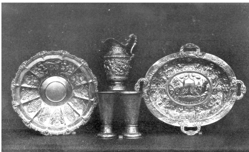
איור 3. חפצי פולחן בתצוגה, תערוכת ההיסטוריה האנגלית-יהודית, לונדון, 1887