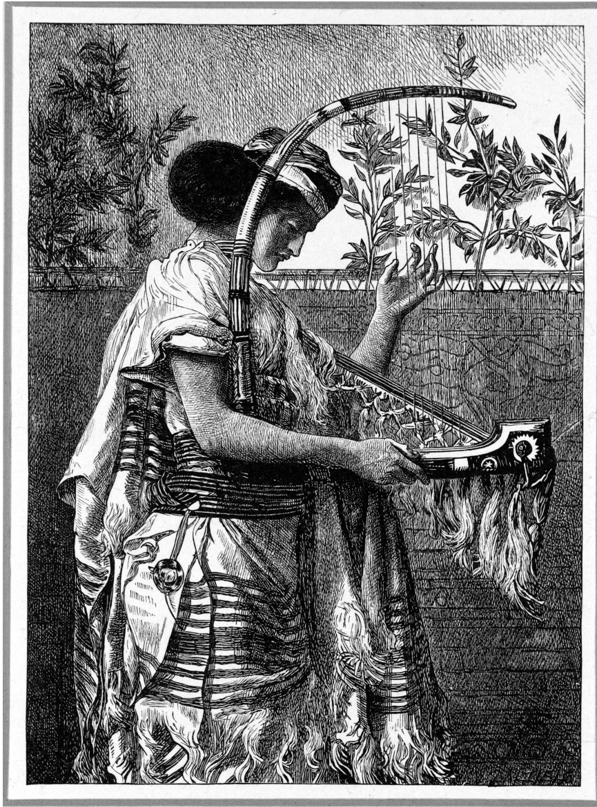
איור 9. סימיון סולומון, 'הושענא', תצריב, הוצא לאור על-ידי האחים דלציאל, 1881, 165x121 ס"מ טייט גלרי, לונדון