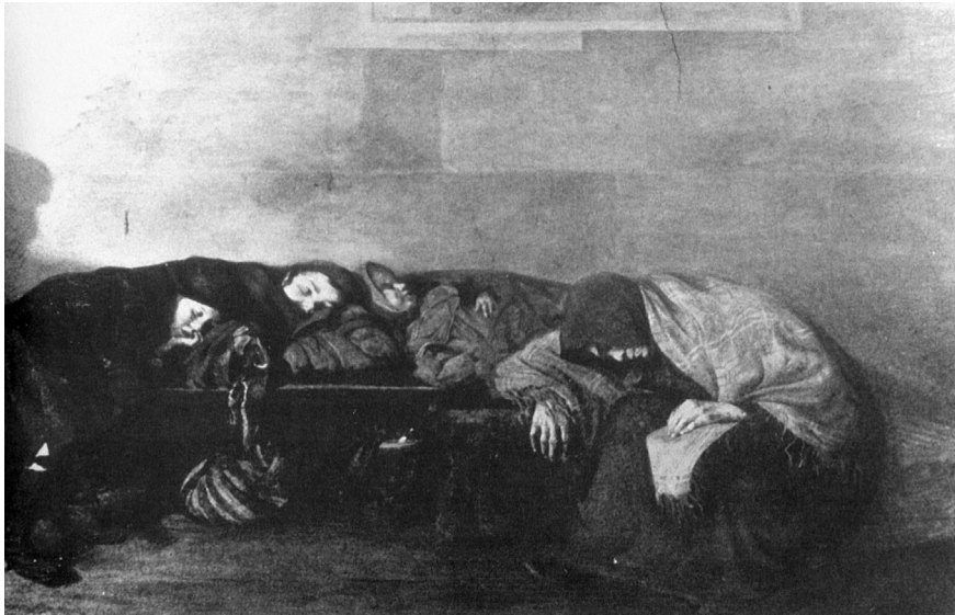
איור 6. לאופולד פיליחובסקי, 'בדרך לגלות', 1906 לערך, שמן על בד הצילום מתוך קטלוג 'תערוכת אמנים יהודים', ברלין, 1907 (ראו לעיל הערה 94)