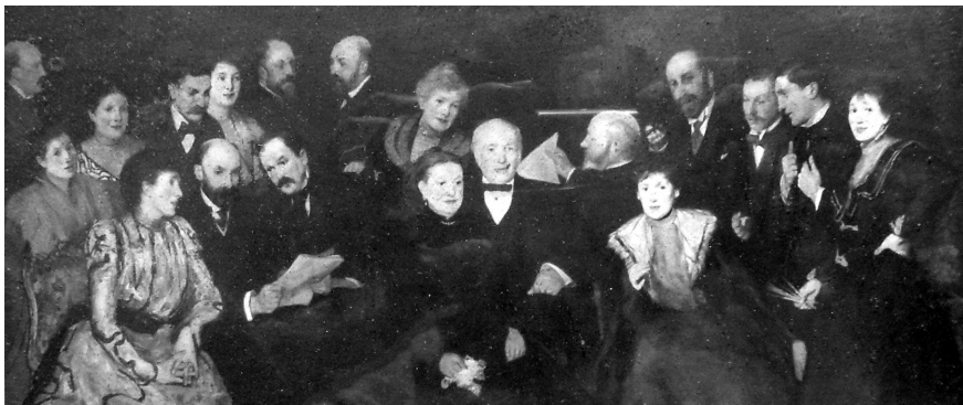
איור 7. לילי דליסה ג'וזף, 'משפחה יהודית', שנות התשעים של המאה ה-19