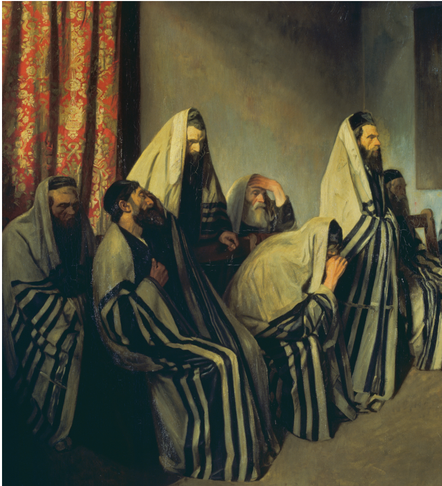
איור 5. ויליאם רוטנשטיין, 'יהודים מתאבלים בבית הכנסת', 1906, שמן על בד, 115.5x127.5 ס"מ טייט גלרי, לונדון