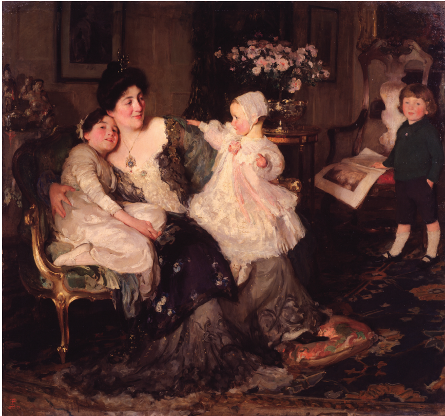
איור 8. סולומון ג'וזף סולומון, 'קבוצה משפחתית: אשת האמן וילדיו', 1905, שמן על בד, 161x175 ס"מ טייט גלרי, לונדון