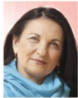
פרופ' מירי עמית

פרופ' מירי עמית התמנתה לאחרונה לתפקיד דיקנית קמפוס אוניברסיטת בן-גוריון באילת. היא תחליף את פרופ' שאול קרקובר, המסיים את כהונתו ב-31 ביולי.